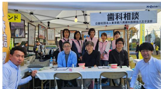
歯科医師会の先生方と協力会員の皆様