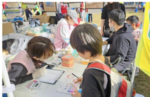
お口の健康相談とRDテストの様子