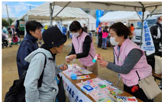
市民に説明をする会員