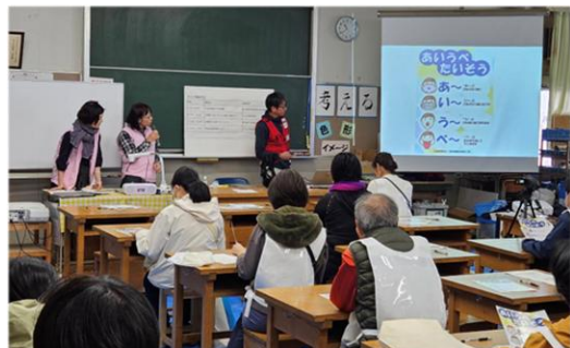
災害時口腔ケアの重要性について登壇