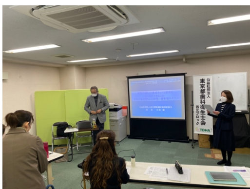
（開会の挨拶の様子）

西北ブロックの会員さまだけでなく、東北ブロック、青森歯科衛生士会の会員様もご参加いただき、とても良いものができたと感じております。次年度も有意義な勉強会を企画したいと思います。